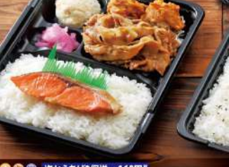
鮭・生姜焼きからあげ弁当 700円