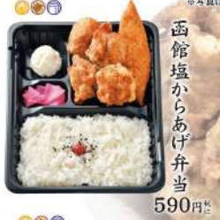
函館塩からあげ弁当 590円

甚兵衛の新定番 塩からあげと、大粒サイズの 手作り塩しゅうまい。 道南地方の食材にこだわった、 甚兵衛オリジナルシリーズ。 塩からあげ2個増 +160円