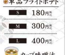
単品フライドポテト S 180円 M 300円 L 400円