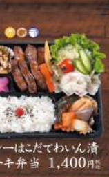
ヘルシーはこだてわいん漬ステーキ弁当 1,400円