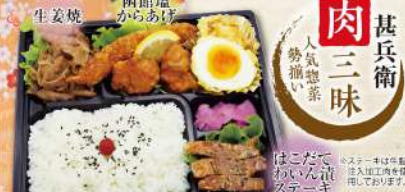
甚兵衛 オールスター弁当 ¥990