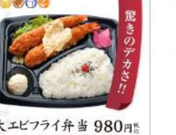
大エビフライ弁当 980円 エビフライ&ヒレカツ弁当 880円