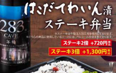
はこだてわいん漬ステーキ弁当 1,180円 MAXはこだてわいん漬ステーキ弁当 2,080円