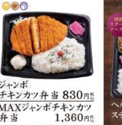
ジャンボチキンカツ弁当 830円 MAXジャンボチキンカツ弁当 1,360円