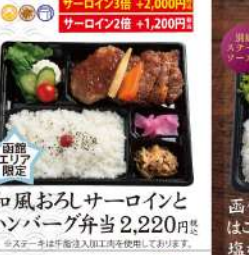
和風おろしサーロインとハンバーグ弁当 2,220円