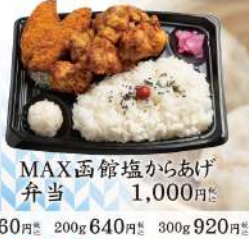
MAX函館塩からあげ 弁当 1,000円