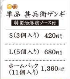
単品 甚兵衛ザンギ 特製油淋鶏ソース付 S(3個入り) 420円 L(5個入り) 680円 ホームバック (11個入り) 1,360円