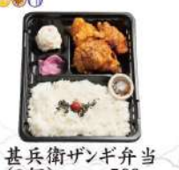
甚兵衛ザンギ弁当 (3個) 560円 (4個) 630円