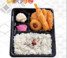
ミックスフライ弁当 720円