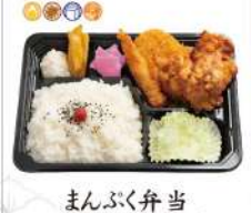
まんぶく弁当 甚兵衛ザンギ 特製油淋鶏ソース付 890円