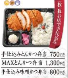
手仕込みとんかつ弁当 750円 MAXとんかつ弁当 1,300円 手仕込み味噌かつ弁当 800円