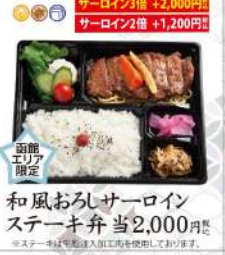
和風おろしサーロインステーキ弁当 2,000円