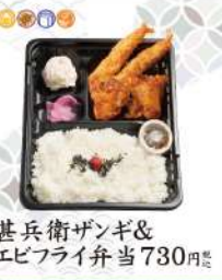
甚兵衛ザンギ& エビフライ弁当 730円