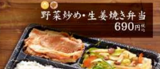
野菜炒め・生姜焼き弁当 690円