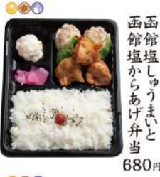
函館塩しゅうまいと 函館塩からあげ弁当 680円