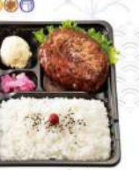
ハンバーグ弁当 880円