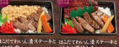
はこだてわいん漬ステーキとかにめし重 1,700円