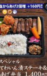
塩からあげ2個増 +160円